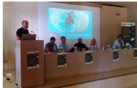
IFSUA en el Seminario internacional ISMAREF