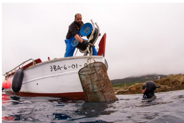
Pescadores submarinos y artesanales unidos para la recuperación de artes perdidos en Port de la Selva

Además, IFSUA, en el marco del proyecto “Plástico o” organizó esta primavera una jornada de recogida, evaluación y monitoreo de plásticos y micro-plásticos en las costas del Maresme (Cataluña).